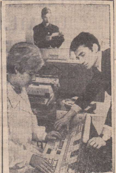
В научно-исследовательском институте механизации и электрификации сельского хозяйства Сибирского отделения ВАСХНИЛ разрабатывается автоматизированная система управления сельскохозяйственным производством.

Хозяйства смогут передавать по специальным каналам связи необходимую информацию в Вычислительный центр института и быстро получать оттуда научно обоснованные данные о рациональном использовании машинно-тракторного парка, о наилучшей структуре посевов и кормопроизводства и о многом другом.